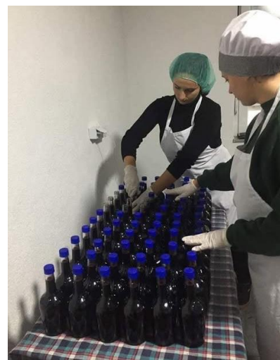
Përgatitja e lëngut të aronisë për shpërndarje në treg.

Zgjerimi do të krijojë gjithashtu mundësi të reja për fermerët lokal, veçanërisht për gratë dhe grupet e marginalizuara, me synimin për të rritur numrin e grumbulluesve me 20-30% dhe për të kontribuar në fuqizimin e tyre ekonomik.