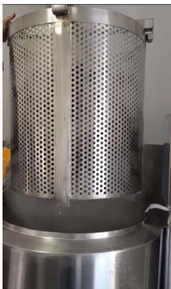
Pajisjet e reja për përpunimin e frutave.

Falë mbështetjes së projektit Përdorimi i Qëndrueshëm i Resurseve Natyrore për Mjedis dhe Zhvillim Ekonomik (SUNREED) të CNVP-së, i financuar nga Ambasada Suedeze në Prishtinë (Sida), Kastrioti ka siguruar pajisje të reja, duke përfshirë një mbushës lëngjesh, ndarësin e farave dhe një rezervuar për pasterizim.